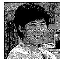
[さがい・みと 原子力技術研究所スタッフ、WIN会員]