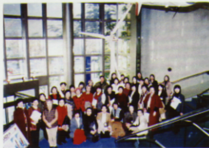
三菱みなとみらい館にて